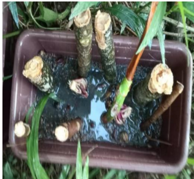
Teknik I (Data 3) Kotak A (8 batang sukun)