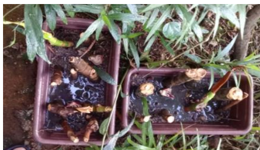
Teknik I (Data 3) Kotak A (8 batang sukun) Kotak B (9 batang sukun)