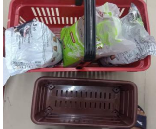
Rajah 1 : Bekas

Teknik I adalah merujuk kepada teknik keratan batang dan disemai dalam 2 bekas tanah campuran. Tanah campuran terdiri dari 3 komponen asas iaitu habuk sabut kelapa (1/3), baja kompos (1/3) dan tanah (1/3). Kaedah siraman air yang berterusan setiap petang agar tanah sentiasa lembap dan menggalakkan pertumbuhan akar dari keratan batang tumbuh. Dapatan data berterusan diambil catat bagi mengukur kadar tumbesaran anak benih berkaitan [1&3].