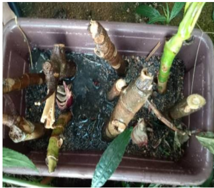
Teknik I (Data 3) Kotak B (9 batang sukun)