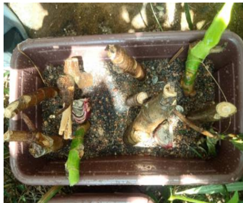
Teknik I (Data 2) Kotak B (9 batang sukun)