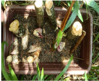
Teknik I (Data 2) Kotak A (8 batang sukun)