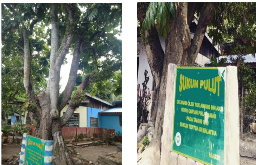
Foto 3: Sukun Pulut Tertua Pulau Aman yang di tanam oleh Tok Awang Akib pada 1890

Pokok sukun yang terdapat di Pulau Aman telah disahkan oleh pihak MARDI bahawa ia ditanam sejak tahun 1890. Ini bermakna pokok sukun pulut warisan sejarah ini telah berumur 131 tahun [10]. Pasti nya pohon sukun tertua berkenaan menghadapi cabaran kepupusan sekiranya benih baka asalnya tidak dijaga dan dikembang biak semula.