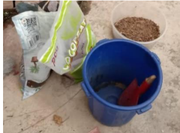
Rajah 2: Tanah Kompos