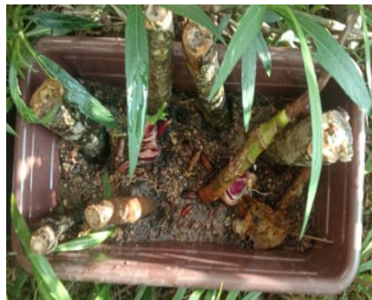
Teknik I (Data 4) Kotak A (8 batang sukun)