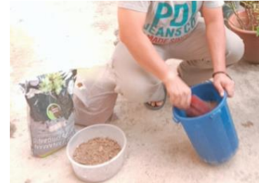
Rajah 3: Campuran kompos

Proses penyediaan kotak dan tanah campuran bagi semaian anak sukun keratan batang