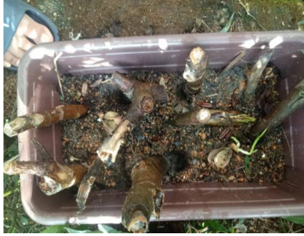
Teknik I (Data 4) Kotak B (9 batang sukun)