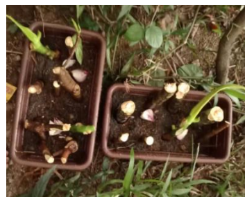
Teknik I (Data 1)