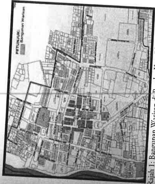
Rajah 1: Bangunan Warisan di Bandar Kota Bharu, Kelantan

Kajian yang telah dilaksanakan pada bangunan rumah kedai lama di Kota Bharu telah mendapati bahawa rumah kedai lama di kawasan ini telah wujud seawal Tahun 1913. Kebanyakan rumah kedai ini masih mengekalkan seni bina asal pada bahagian fasad namun terdapat juga rumah kedai yang telah diubahsua menjadi bangunan baru kerana faktor pemodenan. Rajah 1 menunjukkan Bangunan warisan yang terdapat di Bandar Kota Bharu.