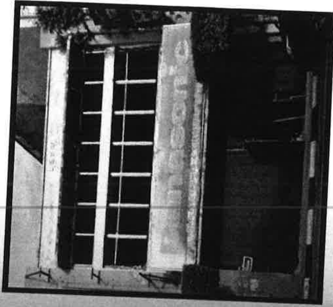
Rajah 5: Rumah Kedai Lama yang dibina pada tahun 1953 Jalan Temenggung

Pertembangan seni barat berlaku pada akhir abad ke-19 hingga kemuncaknya pada tahun hingga 1930-an. Dengan perluasan kuasa British selepas Perang Dunia II, sekatan terhadap ketinggian kedai telah dilakukakan. Rumah kedai hanya boleh memiliki 4 hingga 5 tingkat sahaja. Early Modern merupakan gaya rumah kedai yang terakhir yang aktif dibina. Meskipun rekabentuk Rumah Kedai ke hadapan dari segi pertukangan akan tetapi pengaruh Melayu tidak diabaikan dan disesuaikan ini menyebabkan Rumah Kedai Lama kian dilupakan dan dibiarakan usang. Melalui fasad rumah kedai kelihatan reka bentuk yang sesuai berdasarkan ketersediaan bahan bangunan dan struktur bangu dipacu oleh teknologi dan kejuruteraan seperti rumah kedai dalam rajah 5. Bahan binaan tradisional: jubin bumbung mersellie terracotta , reinforced concrete , logam dan kaca turut diperkenalkan pada bina rumah kedai ini.