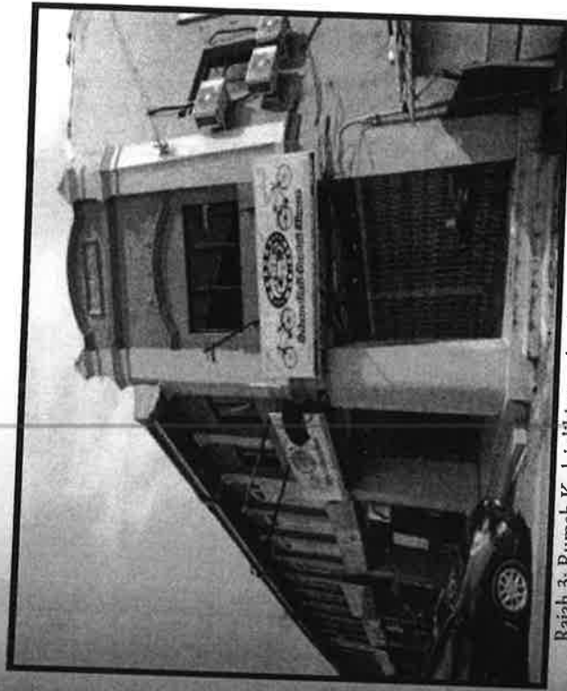
Rajah 3: Rumah Kedai dibina pada tahun 1927 di Jalan Hilir Pasar

Gaya Rumah Kedai Late Straits Eclectic Style merupakan rumah kedai yang mempunyai faedah sangat rumit. Unsur-unsur Neo Klasik seperti daun Acanthus , Doric dan Corinthian Pilasters banyak di pada rumah kedai. Pintu ukiran kayu tradisional Cina menjadi satu butiran klasik. Pengaruh Cina adalah seperti pintu kayu berukir, ruang pengudaraan, laluan udara dan gable end . Zaman Late Straits Style yang wujud sepanjang tahun 1910-an hingga 1930-an dapat dilihat melalui penggunaan seperti penggunaan warna digunakan pada bangunan lama ini. Rumah kedai jenis ini juga disusut terinspirasi dari segi butiran, warna dan corak yang berbeza-beda.