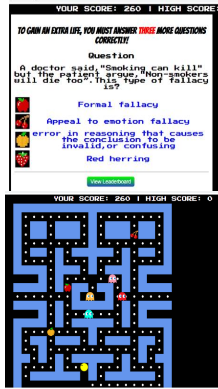
Rajah 1: Contoh Aktiviti ClassTools bagi Kursus FIS