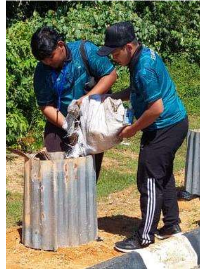
Menggembur tanah dan membaja tumbuhan hiasan dan pokok buah-buahan di sekitar FSB