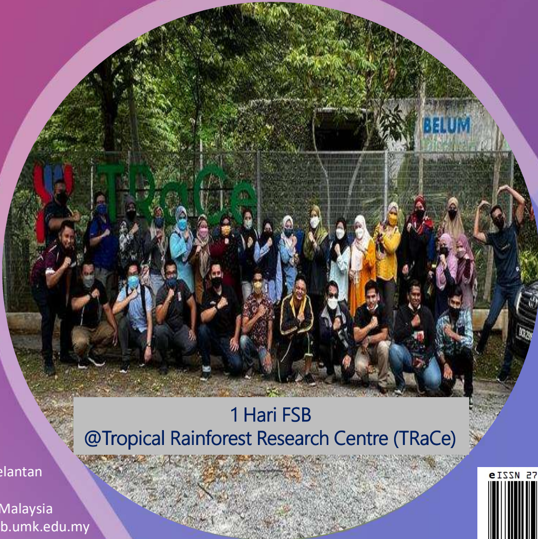
1 Hari FSB @Tropical Rainforest Research Centre (TRaCe)

Fakulti Sains Bumi, Universiti Malaysia Kelantan (Kampus Jeli) 17600 Jeli, Kelantan, Malaysia Laman Web: www.fsb.umk.edu.my Telefon: +609-947 7030 Faks: +609-947 7032