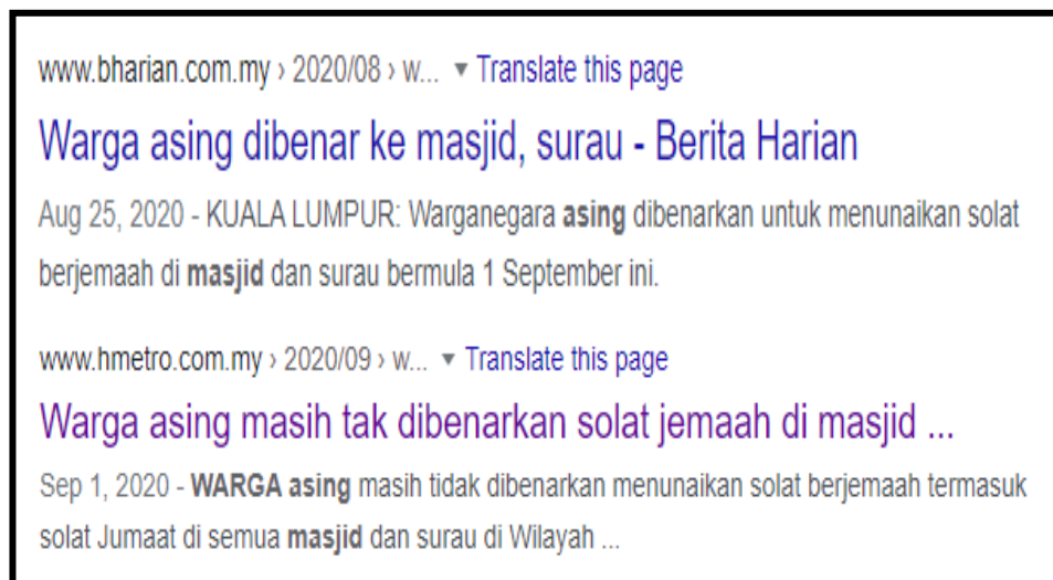
Rajah 1. Dua tajuk akhbar dalam talian yang agak mengelirukan jika tidak difahami konteksnya dengan betul

Demikian pula dalam bidang sastera, beberapa cabaran harus ditempuhi akibat pandemik COVID-19 ini. Sebagai contoh, terdapat penggiat seni sastera yang terdiri daripada golongan veteran. Didapati golongan ini agak sukar untuk mengikuti acara-acara sastera secara dalam talian akibat ketiadaan pendedahan awal tentang dunia teknologi maklumat. Jemputan untuk memberikan ceramah secara dalam talian juga menjadi sedikit sukar kerana khuatir penceramah tidak mahir dengan aplikasi dalam talian seperti Zoom, Microsoft Teams dan sebagainya.