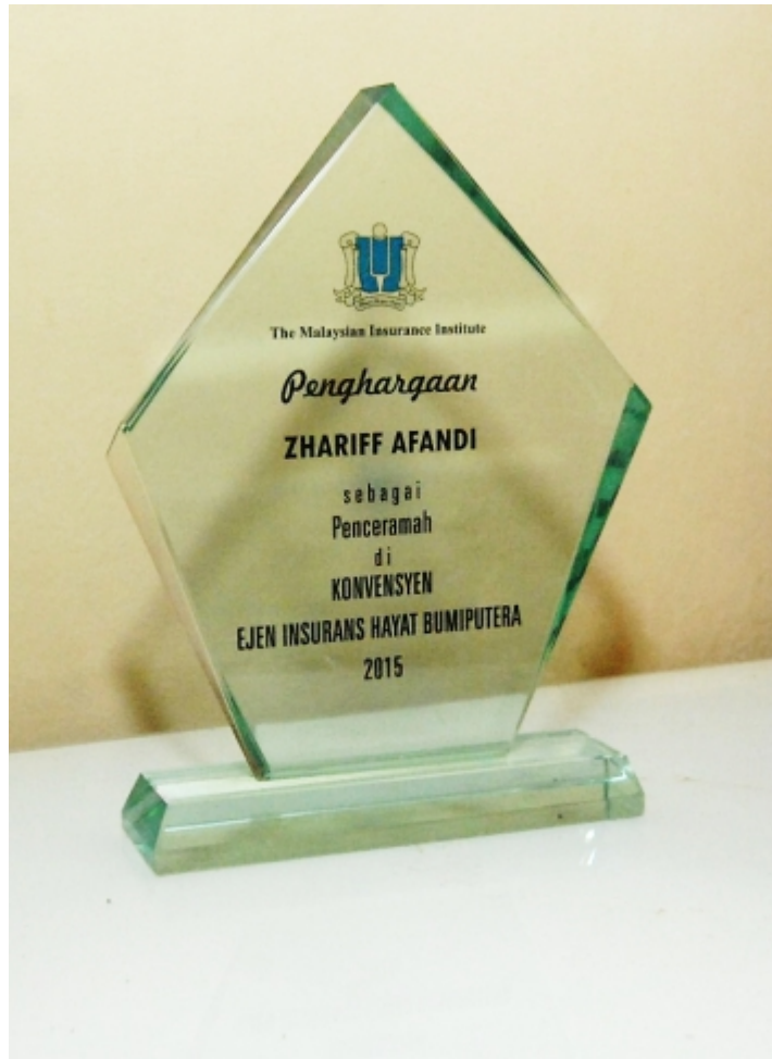
Gambar 32: Penghargaan sebagai penceramah yang pernah antara diterima oleh Zhariff