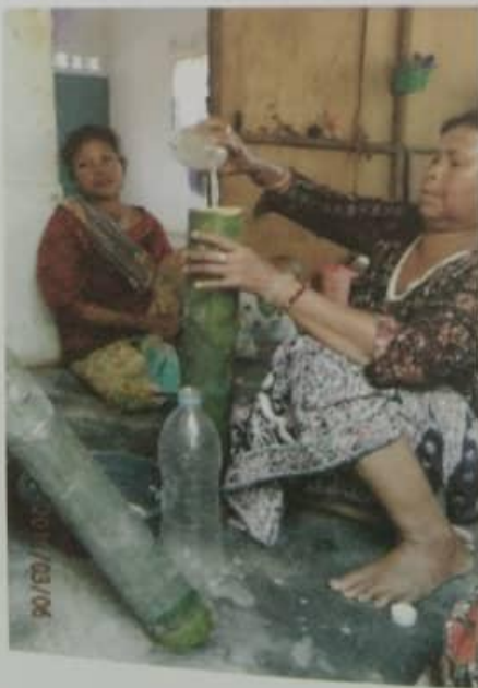
Foto 15.6 Proses memasukkan air ke dalam buluh yang berisi bungkusan nasi.