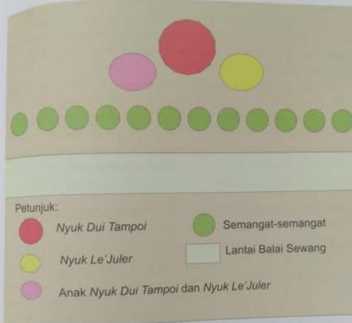
Rajah 15.2 Susun atur lengkor mengikut tuhan dan semangat.

Selain itu, kesalahan yang menyebabkan Tuhan Karei marah adalah seperti membersihkan haiwan buruan di dalam sungai dan melakukan perkara yang tidak bermoral. Bagi mereka yang melakukan kesalahan, perlu mengaku dan pesalah dikehendaki menjamu semua semangat dengan makanan selama tiga hari berturut-turut. Jika selepas tiga hari tiada kilat atau guruh, bermakna Karei telah memaafkan pesalah tersebut (temu bual, Osman, 23 Mac 2011).