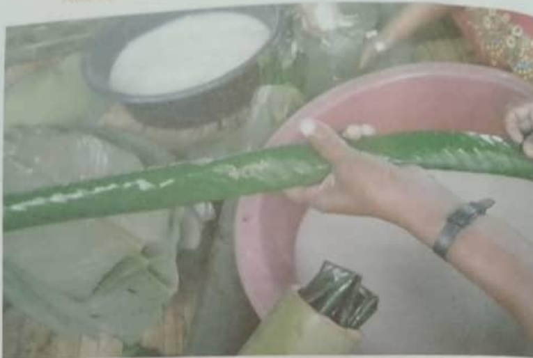
Foto 15.5 Proses memasukkan beras ke dalam buluh.