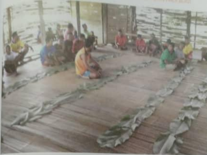
Foto 15.10 Susunan daun lerek semasa kenduri.

di bahagian hadapan. Sebelum menjamu selera, batin mengalu-alukan kedatangan tetamu dan menyampaikan amanat supaya bersyukur dengan rezeki yang diberikan dan tidak bersikap takbur. Batin juga membaca doa sebelum menjamu selera. Doa yang dibaca untuk mengucapkan tanda syukur kepada tuhan yang menjaga langit dan bumi dengan memberikan rezeki (hasil padi) yang baik pada tahun ini.